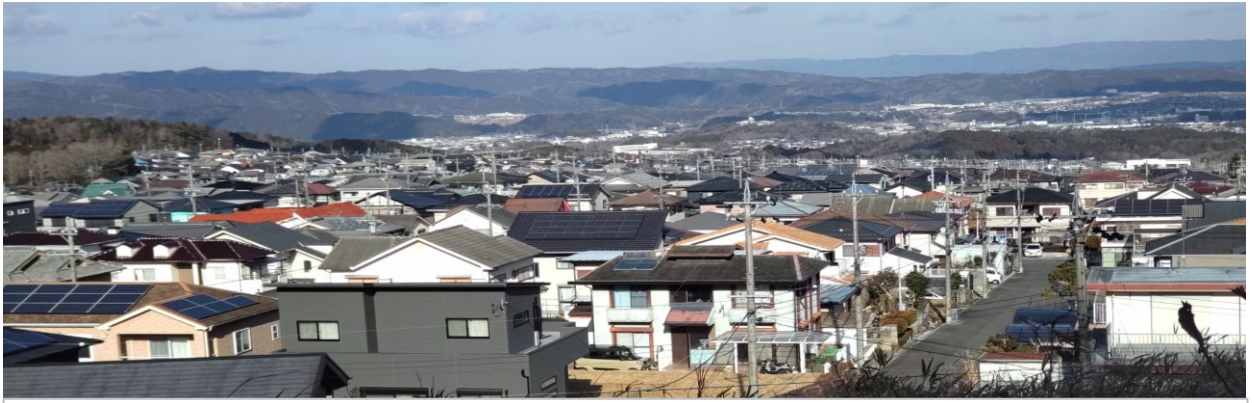
現在の人口分布から75歳前後の人が最も多く、次に50歳前後の人口多くなっている。継続した 高齢者の健康寿命の延伸 が重