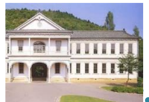
蔵持小学校も保存されています