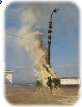
今年のだんども勢いよく燃え上がりました。

本年も皆様のご健康を心より祈念いたしますとともに、活動にご理解、ご協力を賜りますようお願い申し上げます。