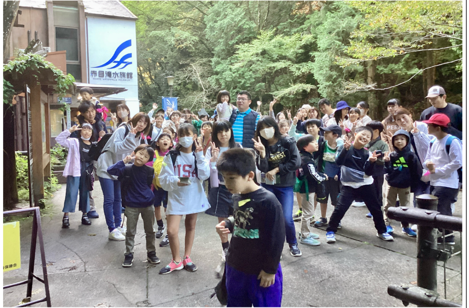
※滝の入口、マイナスイオン漂う赤目滝水族館の前で

増水した赤目渓谷は大迫力。不動滝まで進んだ探検隊一行は、続いて4月リニューアルオープンした赤目滝水族館へ。滝内に生息する魚類や両性類が展示されており、改めて名張の豊かな自然を体感しました。道中子ども達が撮影した写真は箕曲文化祭（今月7・8日）で展示。ぜひ名張の魅力を発見しにきてください。