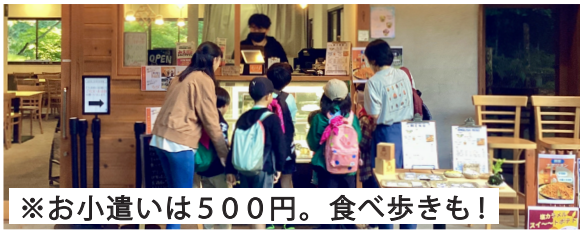
※お小遣いは500円。食べ歩きも!