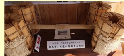
出来上がった松明

近くの檜山(極楽寺所有の松明専用の山)から切り出し、読経の後、ナタを入れます。この日は名張高校の生徒さんも参加し、機械を使って切っていました。最終のクサビ型にナタで割る所は、伊賀一ノ井松明講の熟練のかたが次々と仕上げていきました。