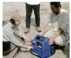
発電機始動、送電訓練(南1区)