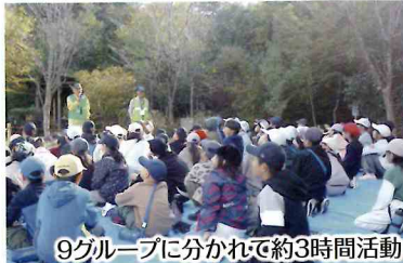
9グループに分かれて約3時間活動

児童からは「キノコなど普段みられないものが見れた」「初めて来ていろいろ教えてもらって勉強になった」「この里山の自然をいつまでも守っていききたい」などのたくさんの感想がありました。