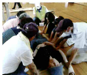
簡易担架作成、搬送訓練(3番町)

3番町(9/16)、南1区(10/27)で地区住民を対象に自主防災隊が企画した体験型防災訓練を実施、協議会総合防災訓練当日は各ブロックごとの訓練にも参加しました。