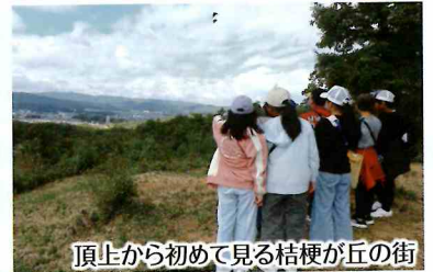
頂上から初めて見る桔梗が丘の街