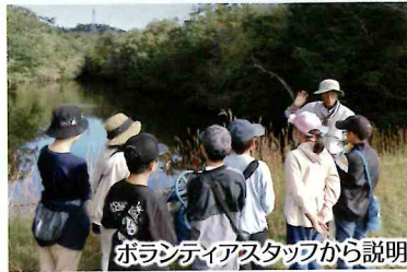
ボランティアスタッフから説明