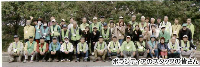
ボランティアスタッフの皆さん