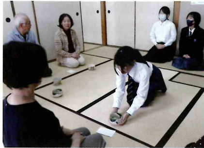
桔梗が丘中学校茶道部

2日目午後から、三味線、書道、水墨画、囲碁、絵画、陶芸、茶道、ビーズ、ゲームなど、センター祭初めての体験型ワークショップに大勢が参加して賑わいました。