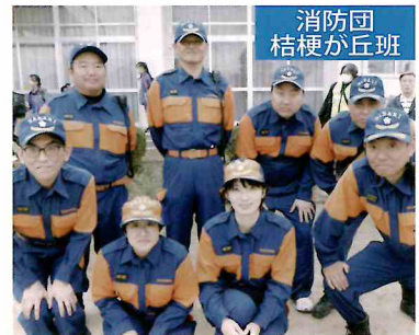
消防団 桔梗が丘班