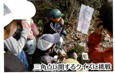
三角点に関するクイズに挑戦

11月13日(水)、奈良県田原本町にある唐古・鍵考古ミュージアムを訪れ、弥生時代の環濠集落から出土された木器・木棺・青銅器などを見学して当時の人々の生活に思いを馳せました。 唐古・鍵遺跡跡史跡公園では、火起こしと勾玉づくりも体験、火起こし体験では、なかなか火がつかず苦戦しましたが、火が起きた時に大きな歓声が上がりました。