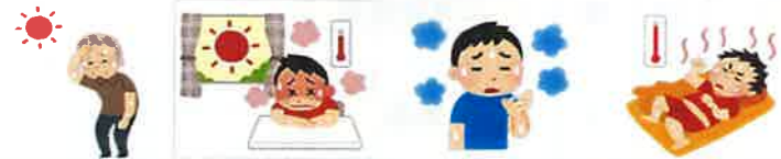
暑くなり始め 急に暑くなる日 湿気が多い日 熱帯夜の翌日