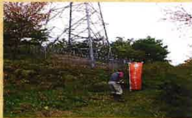
▲ 東山ふれあいの森草刈り