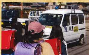
▲ 青色防犯パトロール