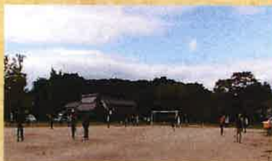
▲ グランドゴルフ大会